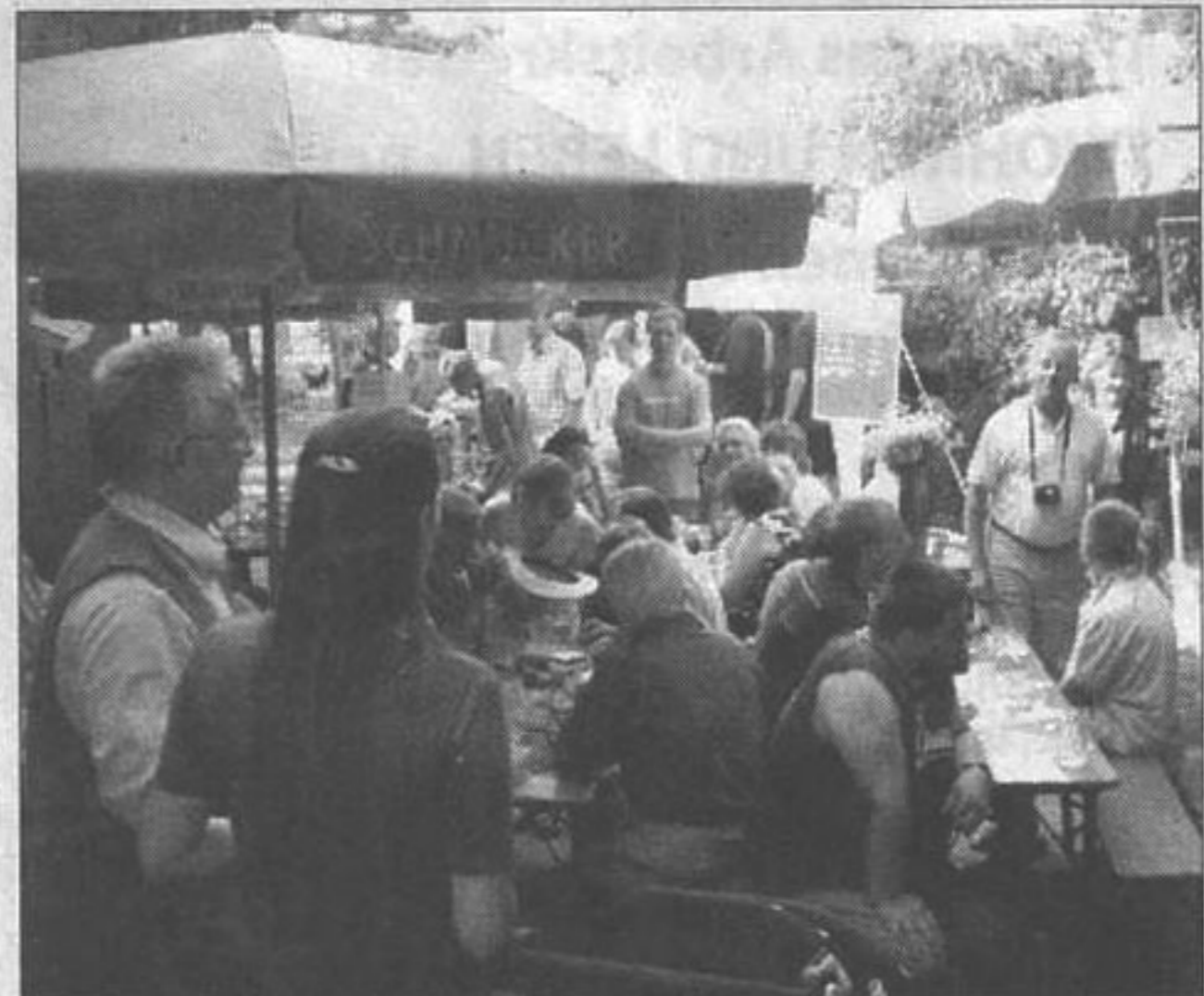
Ein tolles Fest und den ganzen Tag "Volles Haus"

Also dann: "Danke Frau Münch.....und bis zum nächsten Jahr!"