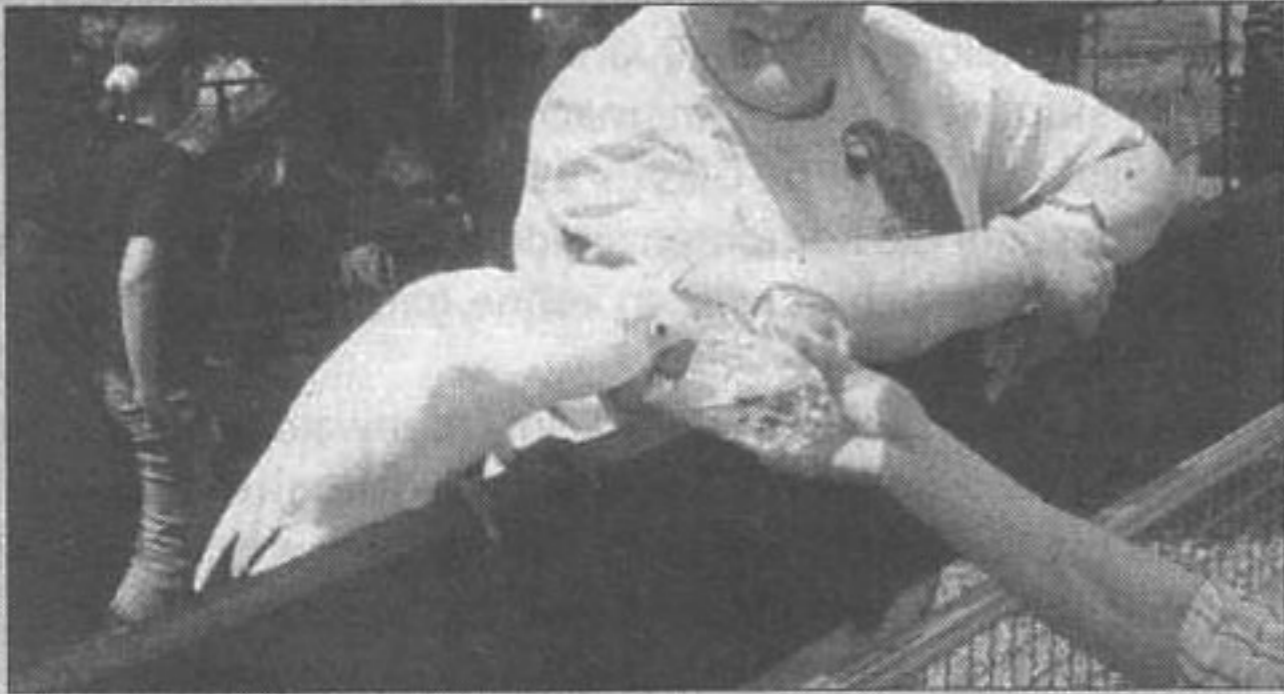
Kakadu Habakuk beim Biertrinken